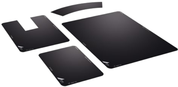
Plaque image DÜRR NDT avec la face active (blanche/bleue) vers le bas.

Les plaques images DÜRR NDT ont été conçues pour répondre aux besoins de l'industrie du CND avec différentes versions afin de couvrir l'ensemble des applications de radiographie.